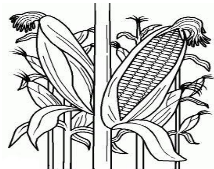
Desenho ilustrativo de milho

Muitos povos indígenas dedicam parte do seu tempo em atividades relacionadas à alimentação. Eles precisam obter e produzir seu próprio alimento. Assim coletam frutos, preparam roças para plantar milho, mandioca, batata e outros alimentos.